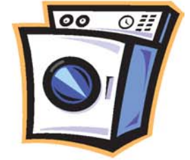
lavadora غسالة gassála