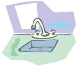
fregadero سقاية siqáia