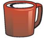
taza فنجان finchán