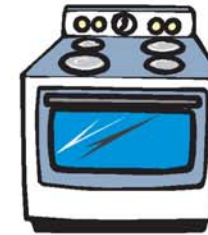
cocina مطبخ márbaaj