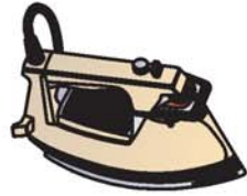
plancha مكواة mikuát