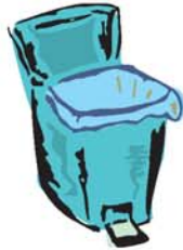
cucho de basura دلو dálu