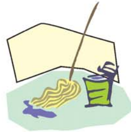
fregona جفافة chifáfa