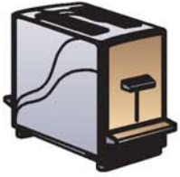
tostadora محمص muhámmis