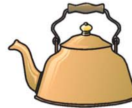
tetera إبريق شاي ibríq xái