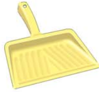
recogedor مجرفة míchrafa