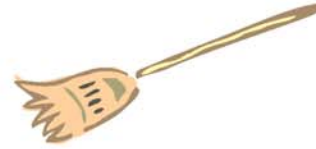
escoba مكنسة míknaša