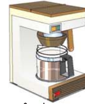
cafetera كافيتيرا kafitíra