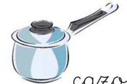
cazo طنجرة tánchara