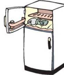
frigorífico براد - ثلاجة zál-lácha, barrád