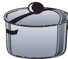
olla قدر qídr